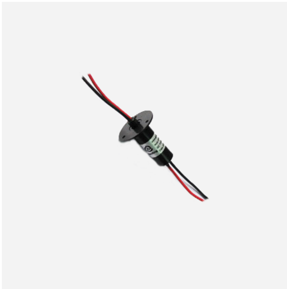
Фото и чертежи